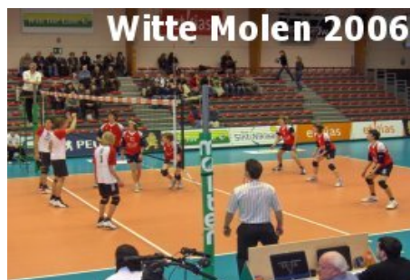
Witte Molen 2006