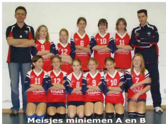
Meisjes miniemen A en B