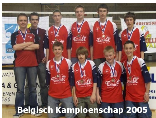
Belgisch Kampioenschap 2005