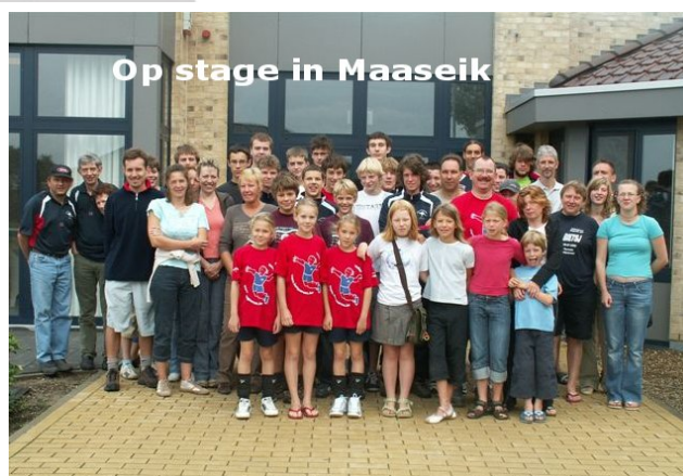
Op stage in Maaseik