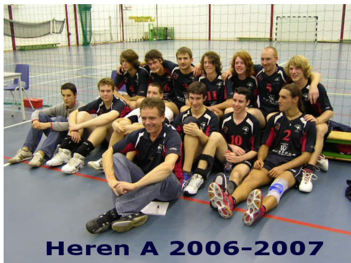
Heren A 2006-2007