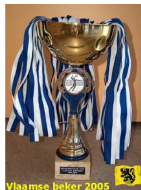
Vlaamse beker 2005